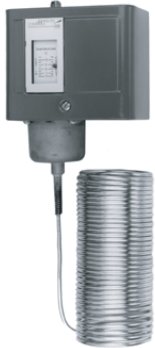
270XT-95008, 9 型